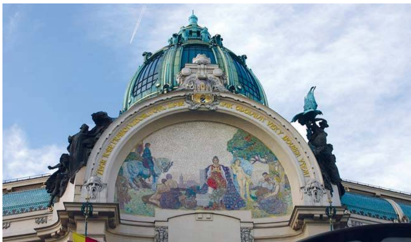
Průčelí Obecního domu s mozaikou „Hold Praze“ od Karla Špillara.

Materiál z knižního katalogu najdeme i ve výstavních sálech na zmíněných miniobrázkách, instalovaných v dlouhém stole uprostřed prostoru. Na nich si doty-