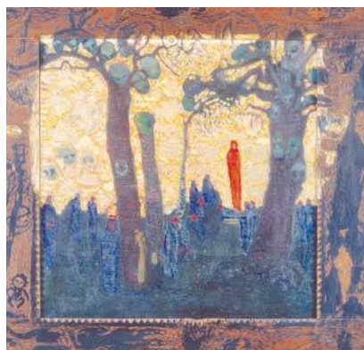
Josef Váchal: Vzývání děbla (1911–1920).

Vrací se sem tedy díla, která byla představena na historicky prvních výstavách roku 1912. Kromě Alfonse Muchy, Maxe Švabinského, Ladislava Šalouna, Jana Preislera či Karla Špillara i dalších umělců, kteří se tehdy přímo podíleli na výzdobě velkolepé novostavby, zde jsou zastoupeni také Emil Filla, Bohumil Kubišta, Jan Zrzavý, Josef Váchal a další. Období počátku 20. století lze ve výtvarném umění, designu i v architektuře charakterizovat jako mohutné věrní. I na jubilejní výstavě proto uvidíme díla tak rozdílných směrů jako jsou secese či kubismus, připomenuta je i dekadence a symbolismus.