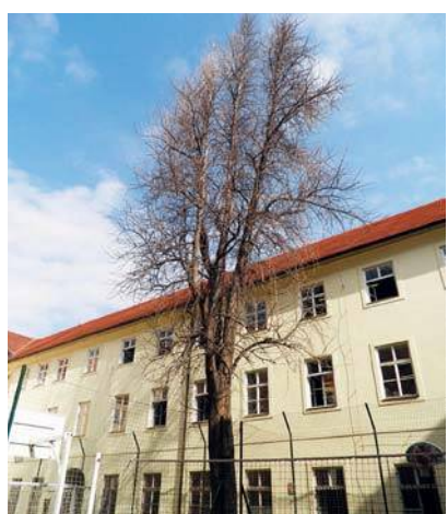
Titul „památný strom“ nese od roku 2007.

vzorovou školu – vzdělávací ústav Budeč, který měl sloužit k přípravě učitelů, a to i žen (nacházel se v místech dnešního křižení ulic Žitná a V Tůních). Součástí Budeč byla také zahrada, ve které byly rostliny uspořádány systematicky i podle svého geografického rozšíření. Na jeho popud byla založena v roce 1869 Fysiokratická společnost, která se zabývala přírodovědným výzkumem a jeho praktickou aplikací především v zemědělství.