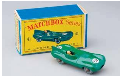
Závodní Jaguar, série 1-75, 1957