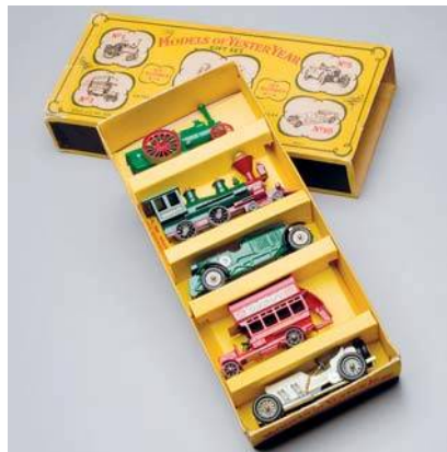
Dárková sada G-6, řada Models of Yesteryear, 1960

Bude na co se dívat. Expozice autiček zahrne modely od 40. do 90. let 20. století,