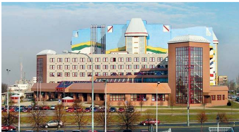
Budova Národního archivu v Praze 4 – Chodovci

Přemysl nejdříve uzavřel smlouvu s Filipem Švábským. Odměnou byla královská koruna. Brzy ovšem přechází do tábora Oty Brunšvického, kterého podporoval papež. Odměna pro Přemysla byla tatáž, královská koruna. Přemysl dokázal prosadit svoje zájmy v obou zneprátelečných táborech. Jenže osud měl tehdy k dispozici ještě jednoho hráče a tím byl mladší Friedrich II. Štauf, žijící v exilu na Sicílii. Když pak vznesl nárok na říšský trůn, jeden z prvních, kdo ho v jeho nárocích podporoval, byl právě Přemysl Otakar I. A mladý císař se uměl svým věrným odměnit. Ostatně, měl na to právo, říše byla v tehdejší západní Evropě vnímána jako určitá nadnárodní korporace, která má vždy hlavní slovo. Díky rozloze, návaznosti na antickou tradici, a ekonomické vyspělosti, bylo slovo říšského panovníka takřka zákonem. Dobový úzus totiž byl, že císař je pánem světa, vládcem všech evropských