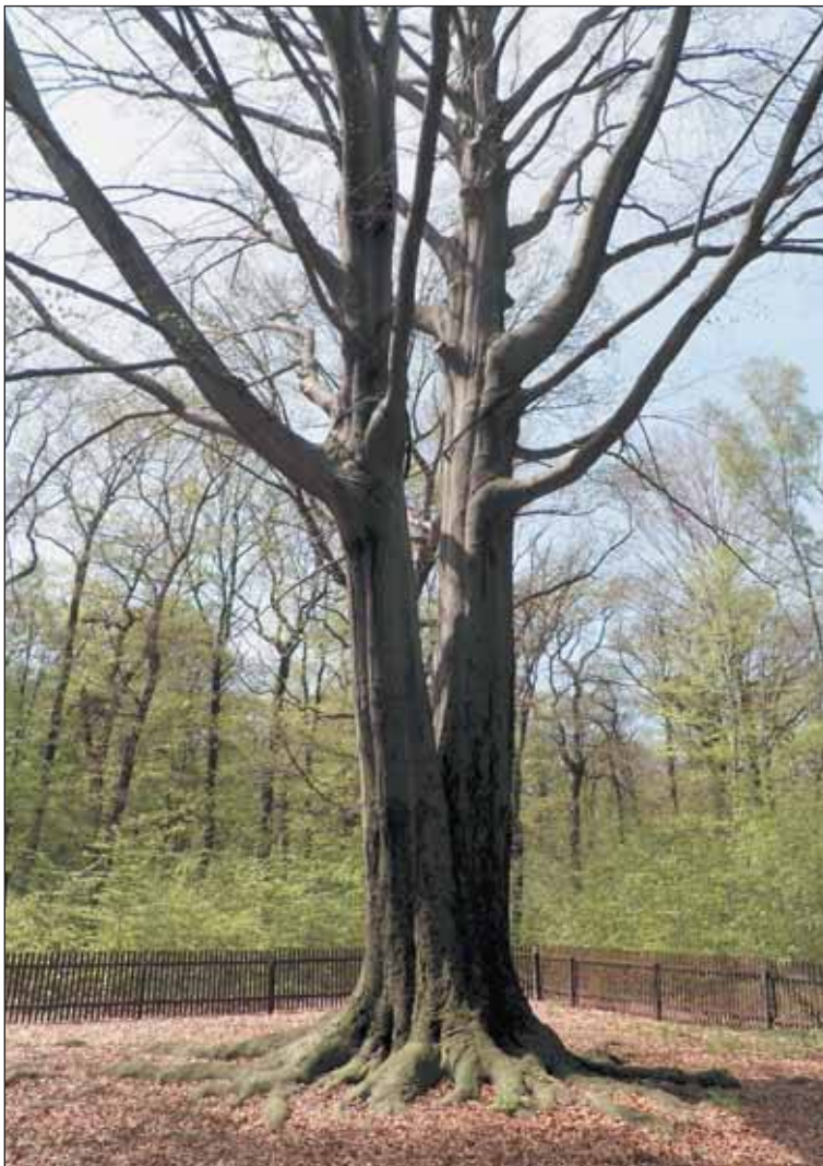
Nejvyšším památným stromem Prahy je buk lesní v oboře Hvězda.

Hned vedle dubu při křižovatce cest kraluje pro změnu statný buk. O jeho nadprůměrném vzrůstu není pochyb. Strom přitahuje návštěvníky často i v zimě. O Vánocích bývá osvěcen žárovíčkami a vždy tím zpestřuje podvečerní vycházky oborou. Uplynulé Vánoce bohužel rozsvícen nebyl, což zdůvodňoval magistrát úsporou peněz.