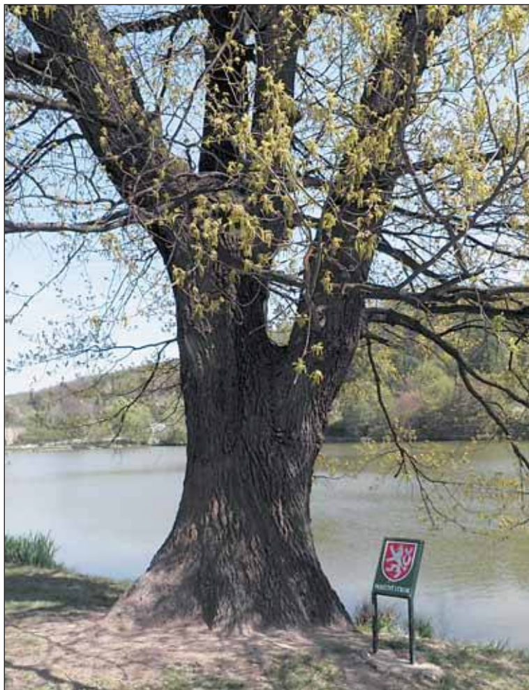
Na hrázi Libockého rybníka mnohé upoutá solitérní dub letní.

Praha se tím připravila o velkou raritu. Zářící památný buk jinde v republice nenajdeme.