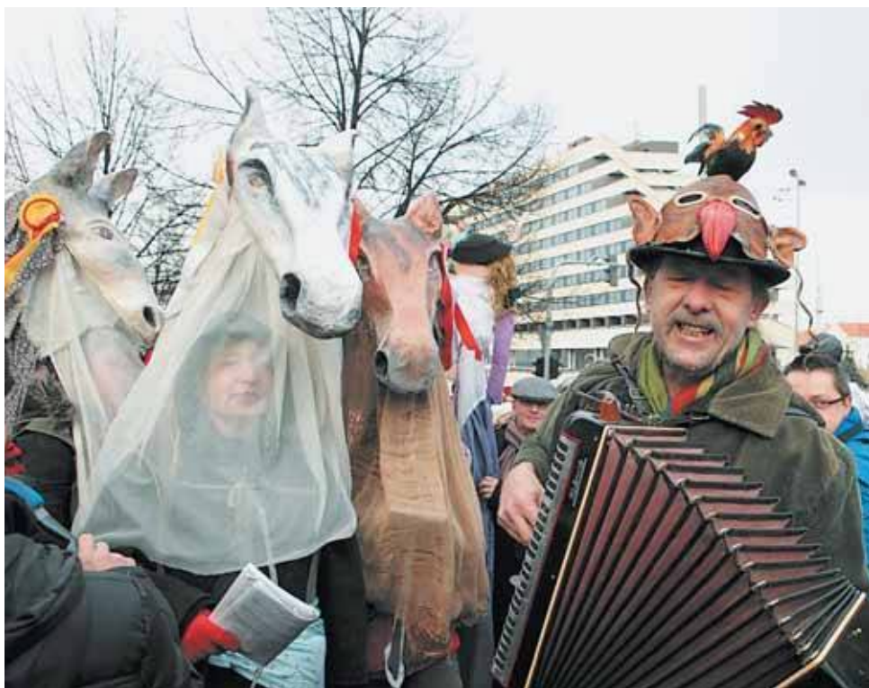
Již po osmnácté prošel Břevnovem masopustní průvod, tentokrát s maskami na téma řemeslo má zlaté dno. Ve stejném duchu se nesl i tradiční masopustní bál.