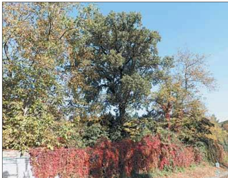
Suchardův dub v Bubenči je významný především z kulturně historického hlediska.

Památným stromům Prahy 6, ale i všem dalším v celé metropoli, se věnuje velkolepá výstava „Památné stromy Prahy se představují“. Koná se od 3. do 25. března v Botanické zahradě v Troji. K vidění bude řada foto-