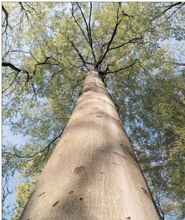
Buk lesní naproti Ruzyňské bráně má nádherný rovný kmen nesoucí bohatou korunu.