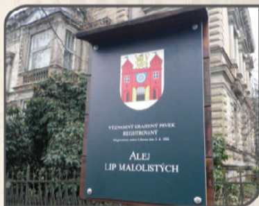
Zvýšená ochrana stromů může být zajištěna registrací jako významný krajinný prvek (fotografie ukazuje označení aleje v Liberci)