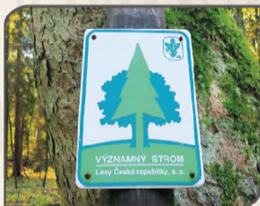
Na pozemcích Lesů České republiky jsou významné stromy označovány speciálními cedulemi