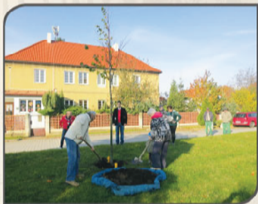
Občané pražských Běchovic sázejí Lípu republiky u příležitosti výročí 20. let České republiky. Slavnostní výsadba proběhla 19. 10. 2013 a obyvatelé Běchovic se tím zároveň připojili k oslavám Dne stromů.

stromem. V centrech velkých měst můžeme, vzhledem ke znečištěnému a více stresujícímu prostředí, přihlídnout i k našim nepůvodním dřevinám, jako je platan nebo jinan.