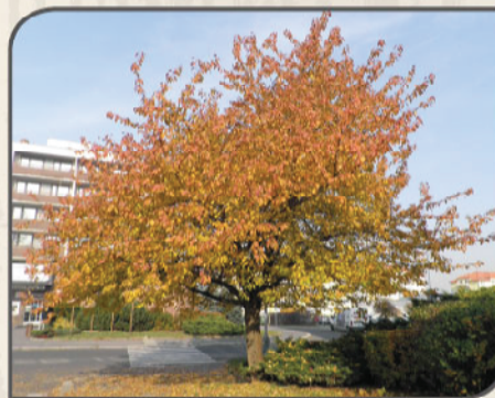
Třešeň ptačí u úřadu MČ Praha 15 v Horních Měcholupech

Stromy jsou nejvýraznější, nejkrásnější a nejdůležitější složkou městské přírody. Jsou to též největší a nejdéle žijící organismy ve městě. Žijí desítky i stovky let, a pokud je o ně dobře pečováno a přistupuje se k nim s určitou vážností, přežívají celé generace obyvatel.