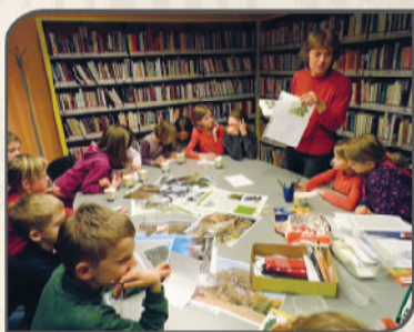
Povídání a program na téma „Stromy“ během Nocí s Andersenem v knihovně na pražských Stodůlkách (1. 4. 2011)

Při práci s dětskými kolektivy můžeme prostřednictvím her či tvůrčích činností podnítit u nich ještě větší zájem o stromy. Poznávání základních druhů stromů můžeme považovat za banální věc, ale ta je důležitá pro snížení anonymity veřejné zeleně. Jednotlivé druhy stromů se najednou stávají snáze identifikovatelné, což buduje lepší vztah dětí ke stromům.